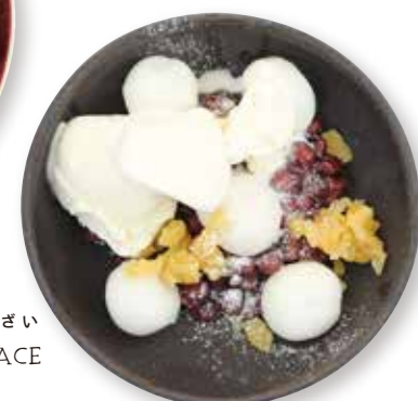
両国テラスクリームぜんざい RYOGOKU TERRACE ZENZAI SWEET RED BEAN SOUP WITH MOCHI & VANILLA ICE CREAM